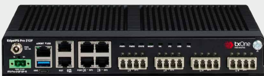
EdgeIPS Pro 212F Rugged