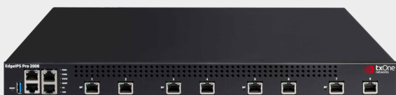
EdgeIPS Pro 2008